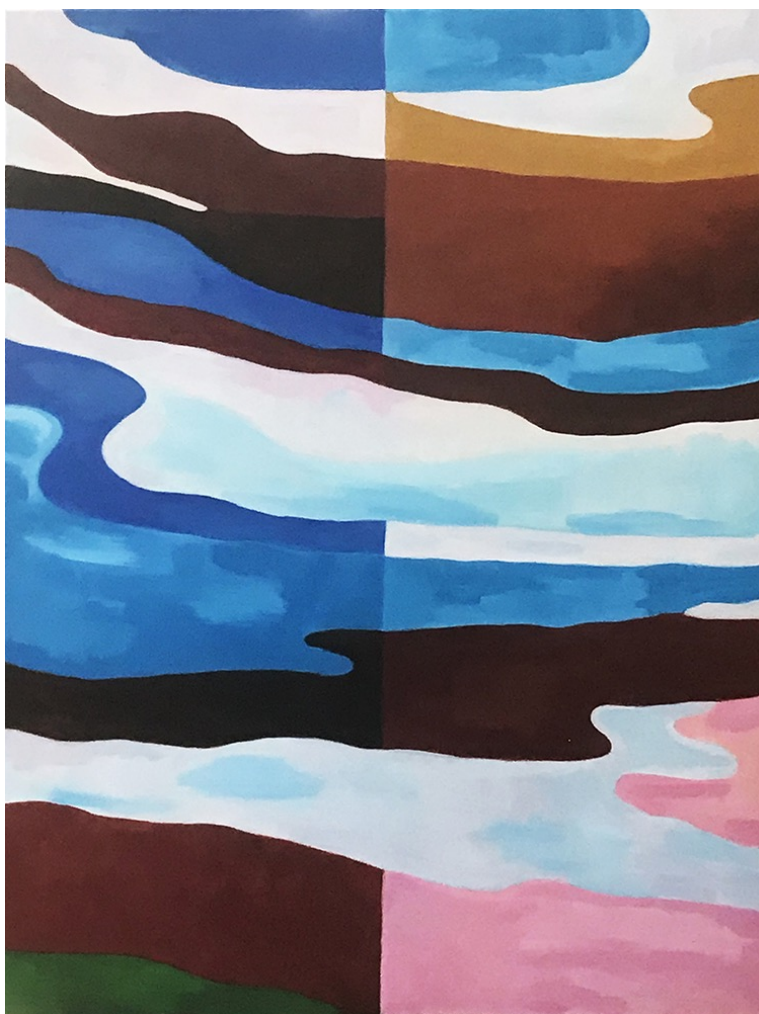
huile sur toile, 116x89 cm, 2020